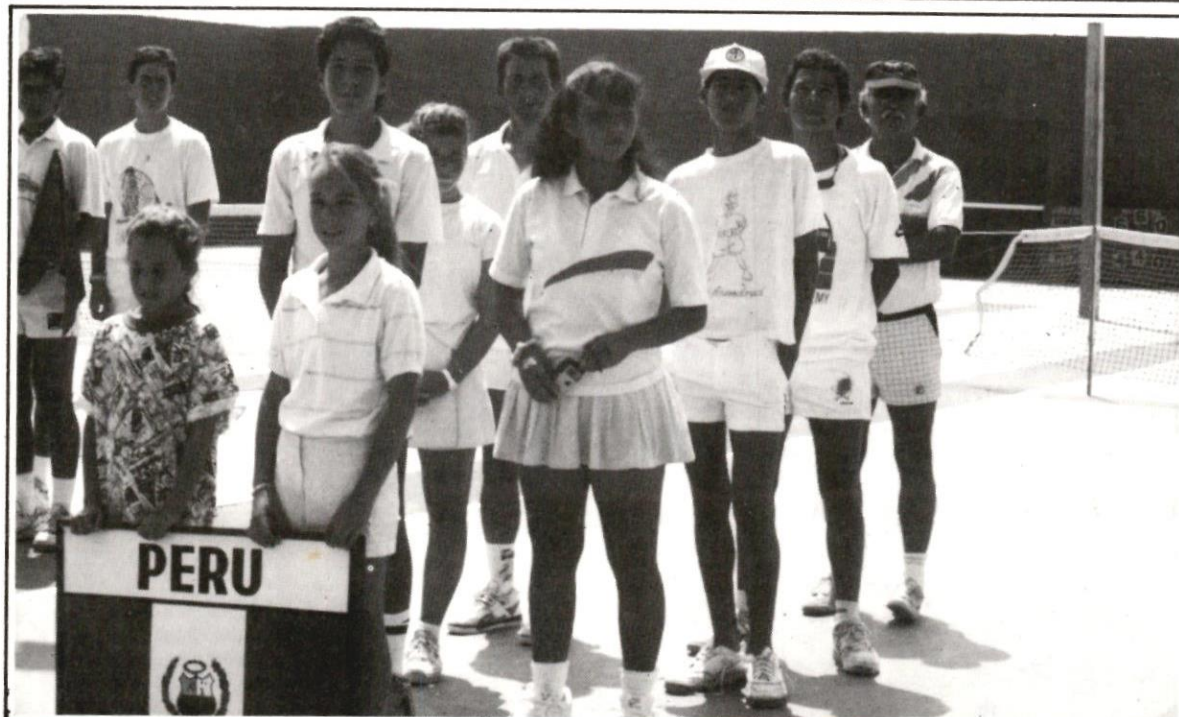
SALINAS: Los integrantes del equipo peruano al torneo Copa Cosat eliminatoria zonal jugada en Ecuador.