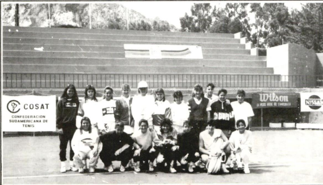
La Paz, circuito femenino. Una panorámica del estadio y un grupo de competidoras.