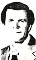
Director Denny Crum U. of Louisville