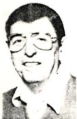
Director Lou Carnesecca St. John's U.