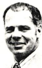
Past President Jud Heathcote Michigan State U.