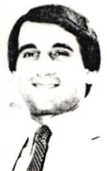
Director Mike Krzyzewski Duke U.