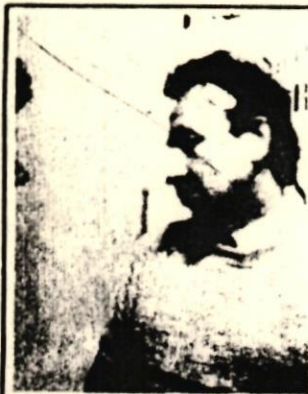
CON EL parche , después de ser atendido en el tópico médico del estadio.

No sabemos si es hinch de Universitario. Pero sí que fue una de las muchas víctimas que deja como saldo el comportamiento peligroso de las barras. ¿Hasta cuándo seguiremos comentando sobre estos incidentes?