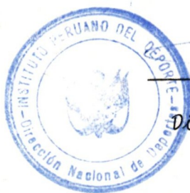
ALFREDO DEZA FULLER